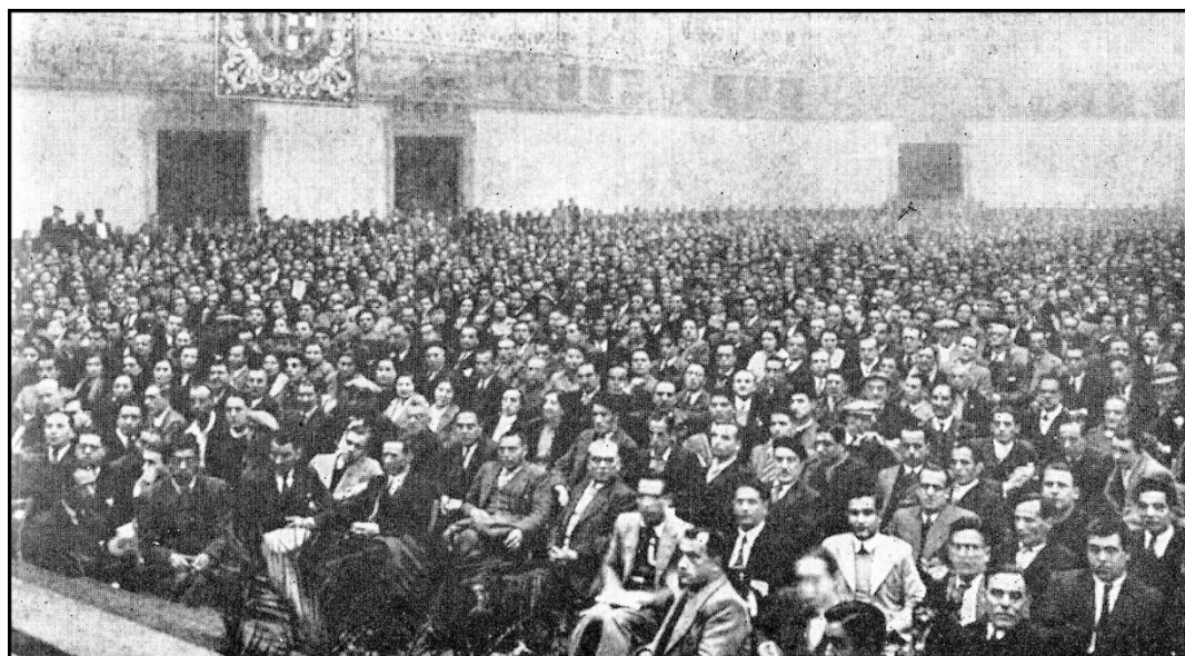
5 de diciembre de 1936. Primera Jornada de la Nueva Economía Palacio Nacional de Cataluña. Montjuich

Las oficinas de estadística, que en el régimen presente sólo tienen una función decorativa, pues raramente se tienen presentes sus aportes, incompletos y falseados, tendrían su centro en este Consejo y proporcionarían indicaciones precisas para la regulación de la nueva economía.